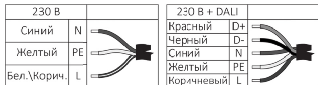
Рисунок 2. Схема подключения питания.